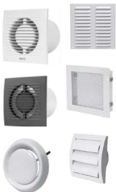
Tabela de Preços