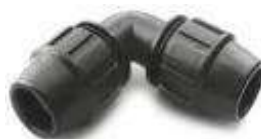
Tabela de Preços